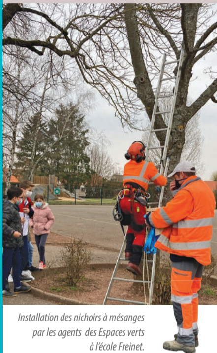
Installation des nichours à mésanges par les agents des Espaces verts à l'école Freinet.

Chaque année, les périodes printanières et estivales marquent l'apparition des chenilles processionnaires dans les forêts, parcs et jardins. L'exposition aux poils urticants de ces insectes a un impact sur notre santé et celle de nos animaux (éruptions cutanées, démangeaisons, conjonctivites, toux irritatives, etc.). Afin de lutter contre ce phénomène, la ville de Marly a mis en place des nichours à mésanges sur l'ensemble de la commune. Ces oiseaux, grands prédateurs de chenilles processionnaires, vont aider à réduire la prolifération de ces dernières dans des concentrations acceptables au cours des prochaines années. Au total, 42 nichours seront installés. Deux d'entre eux ont été placés à l'école élémentaire Freinet : les élèves de CM2 ont pu assister à l'installation et obtenir toutes les explications nécessaires grâce aux agents communaux qui étaient présents. Cette action précède la mise en place de 20 pièges à phéromones visant, quant à eux, à limiter l'accouplement et à réduire la ponte et l'émergence des chenilles. Celle-ci aura lieu fin mai début juin.