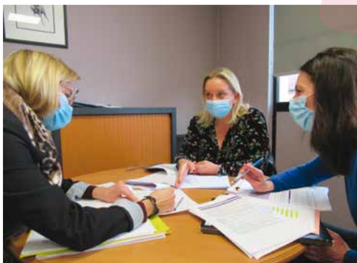
Chacune dans son rôle, elles travaillent en parfaite symbiose pour le bien de Marly.